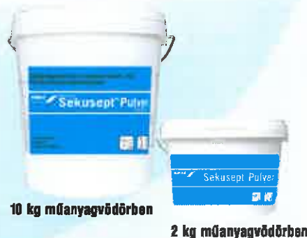
10 kg műanyagvodorben